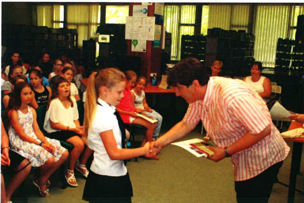
Az egyik díjazott