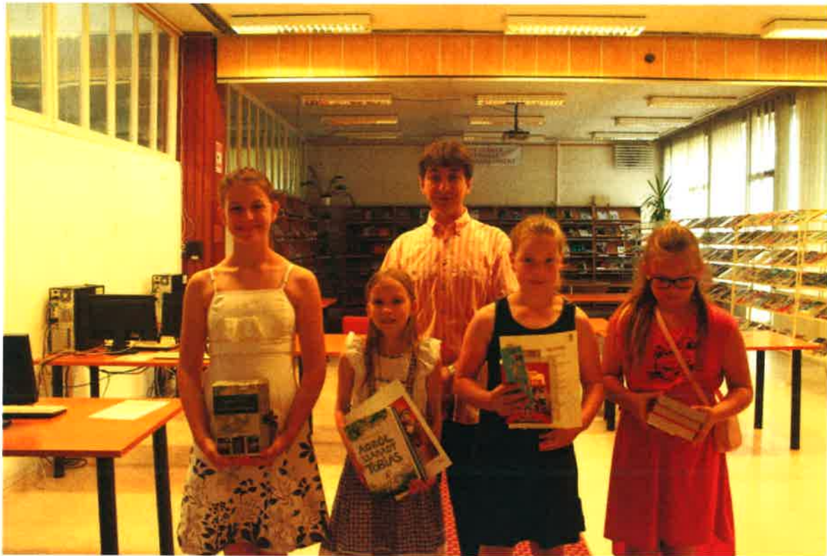
A legtöbbet olvasó Könyvfalók