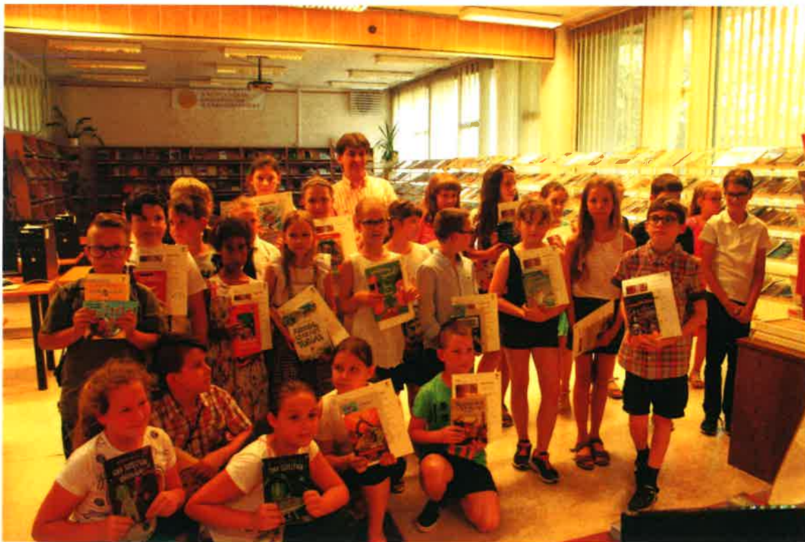
A díjazottak egyik csoportja